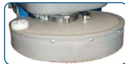
PUMA MODELO 450