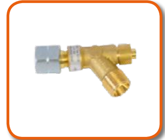
Válvula de seguridad corte de gas