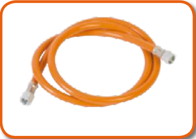
Tubo de gas 5 m