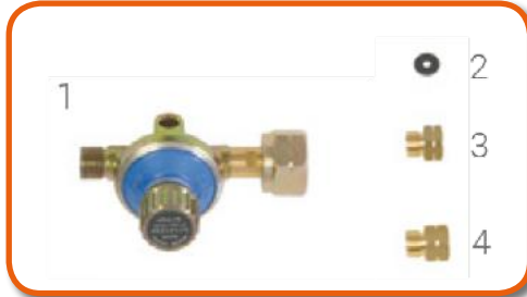
Válvula de reducción de presión