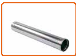
Tubo de acero inoxidable Ø120 mm - 1m. de longitud. Cod. 02AC420