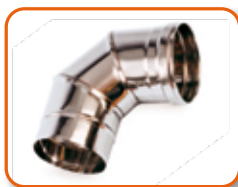
Curba de acero inoxidable de 90° - Ø120 mm. Cod. 02AC421