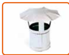
Terminal de acero inoxidable Ø120 mm. Cod. 02AC422