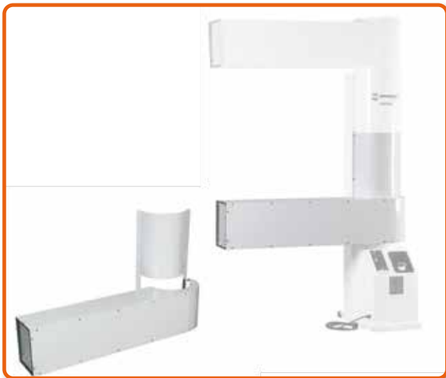
Adaptador de salida de aire. Cod. 02AC672