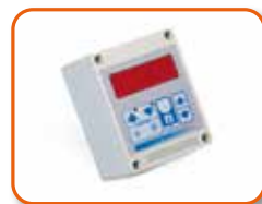
Termostato electrónico de precisión IP55 con display -10/+70°C sin cable. Cod. 02AC294