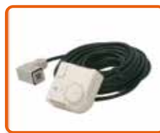
Termostato ambiente con 10m cable y conexión. Cod. 02AC581