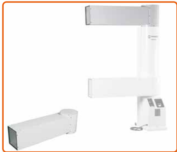
Adaptador de entrada de aire. Cod. 02AC671