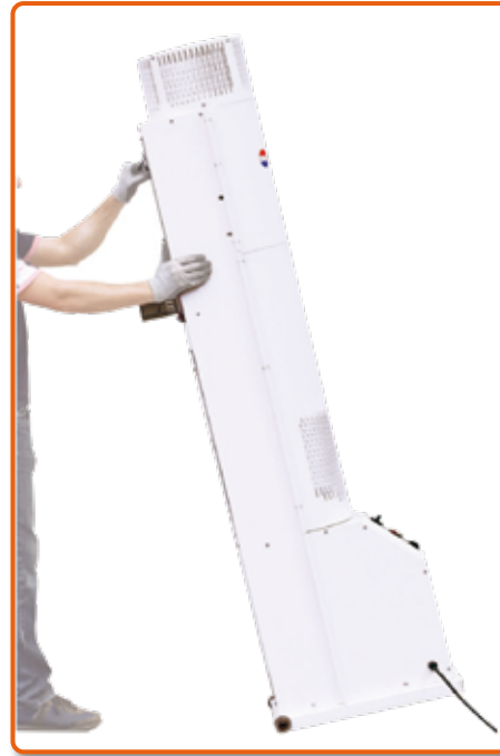
Incorpora ruedas para su fácil manejo