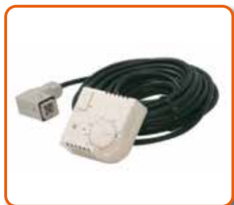
Termostato ambiente con 10m cable y conexión.