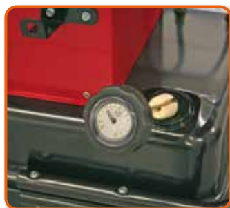
Indicador de nivel de combustible. Cod.: 02AC508