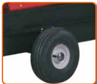
Kit ruedas neumáticas Ø 250 mm. Cod. GE55: 02AC598 Cod. GE85: 02AC599