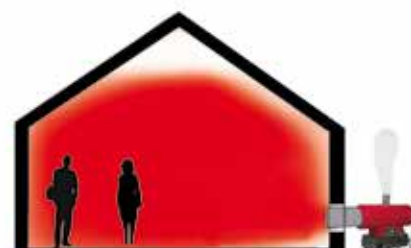
SÓLO VERÁS UN AMBIENTE CÁLIDO