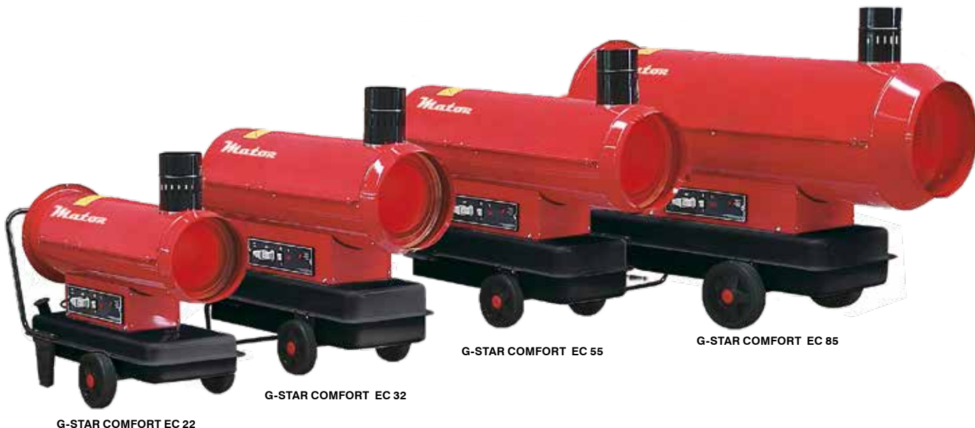
G-STAR COMFORT EC 22

Generadores de aire caliente - combustión diésel indirecta