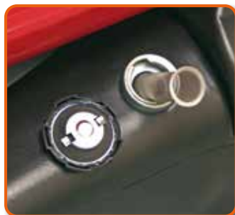
Filtro de llenado para el depósito de combustible. Cod.: 02AC556