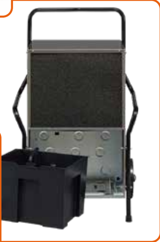
Cubeto de recogida de agua extensible para DB-55 y DB-80