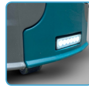
Luz LED de alto brillo 18W

Una fregadora ideal para una variedad de sectores, como grandes áreas industriales, almacenes, centros logísticos, complejos comerciales.