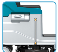
Puerto y visor de carga de agua limpia