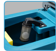
Boya de seguridad para el motor de aspiración.