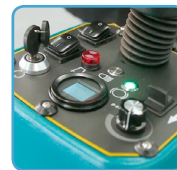
Controles sencillos e intuitivos, interfaz digital, palanca de marcha y regulador de velocidad