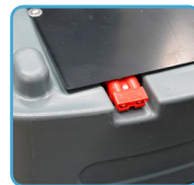
Fácil acceso a conexión de carga de batería