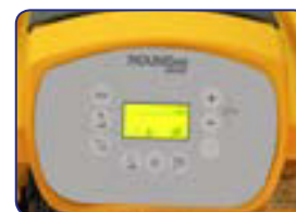
Panel de control con pantalla luminosa