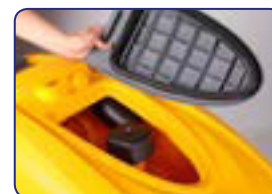
Filtro para partículas grandes + filtro otor de aspiración