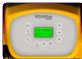
Contraseña para iniciar el funcionamiento