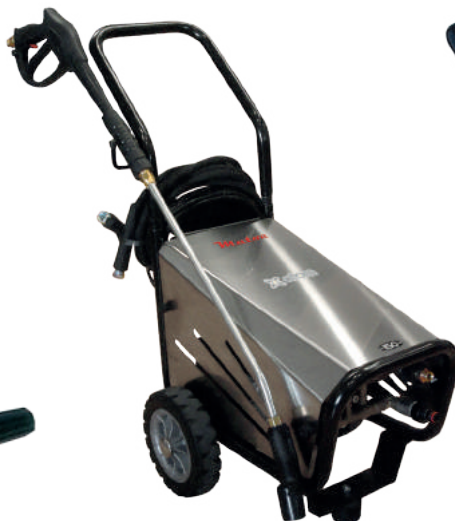
ATOM 150 TST