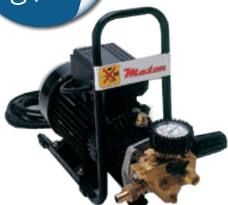
ATOM WATER GUN - 200