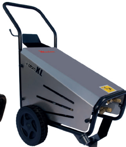
ATOM 200 XL